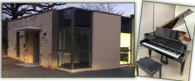
Nos locaux à Assier

Nous sommes présents à Labastide-Murat, Assier et Saint-Cernin.